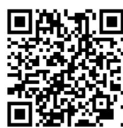
北教大學術單位聯繫方式